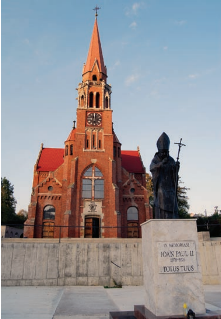
Bazylika i pomnik bł. Jana Pawła II w Kaczycy

W 1996 roku kościół w Kaczycy podniesiono do godności sanktuarium diecezjalnego, w 1997 – sanktuarium narodowego, a w Roku Wielkiego Jubileuszu, 14 marca 2000 roku papież Jan Paweł II nadał świątyni kaczycyjskiej tytuł bazyliki mniejszej.