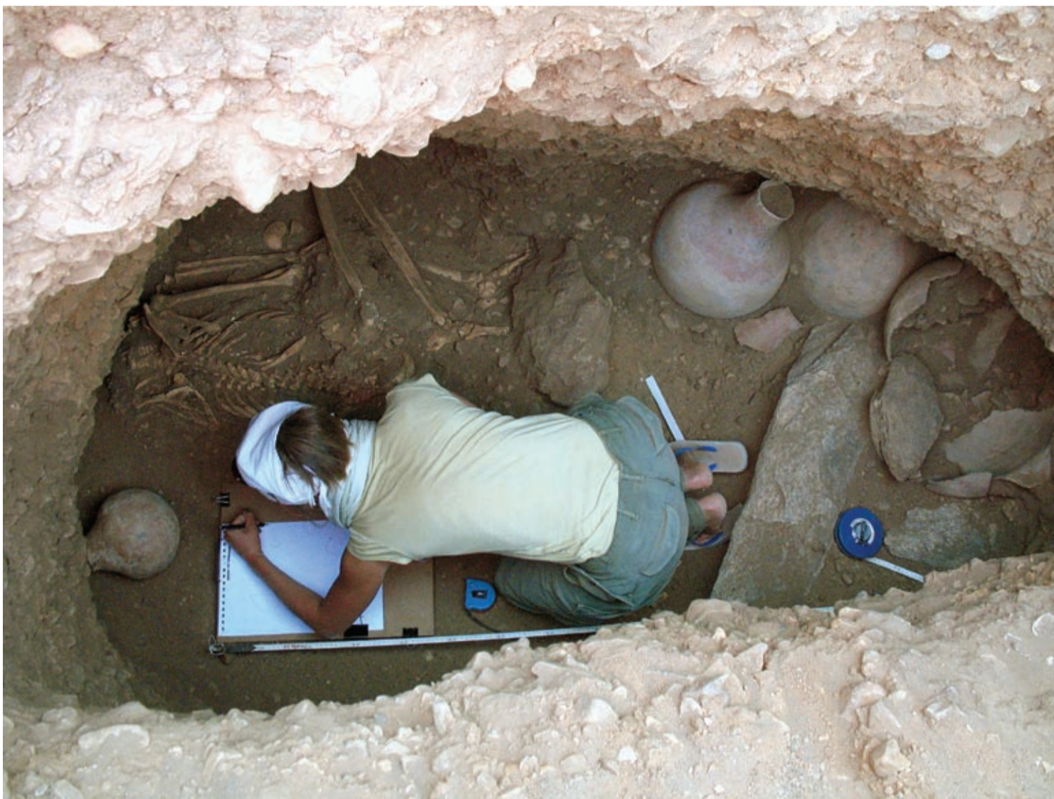
W komorze grobowej pochówku meroickiego

Był to teren wojowniczego plemienia Manasir. Gdy przyjechalśmy do bazy, nasz szef wyjechał do Chartumu, żeby załatwić jakieś papiery. Ja, jako osoba mówiąca po arabsku, musiałam zająć się kontaktami z ludnością miejscową. A miejscowa ludność pewnego dnia przetrzymała nam dokument: na tekturze naklejona kartka z zeszytu, a na niej – po arabsku – długi, długi tekst. Niestety – nie czytałam i nie czytam po arabsku (potrafię się wysłowić, potrafię zrozumieć, ale nie umiem ani czytać, ani pisać). Ten tekst zaś przeczytała inspektorka, która, z kolei, nie za bardzo potrafiła nam go wytłumaczyć, bo średnio znała angielski. Co potrafiła powiedzieć, to powiedziała. Sens był następujący: my, starszyzna wioski, nie chcemy, żebyście tu byli i rozkopywali zabytki, a (i tej drugiej części nam akurat nie przetłumaczyła) jeśli nie opuścicie wioski w ciągu doby, to was zabijemy. Podpisem były zdjęcia ludzi w turbanach.