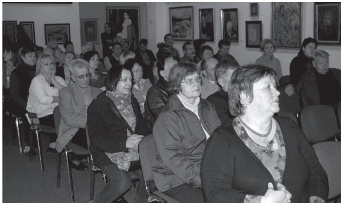
Podczas otwarcia wystawy

Ekspozycja we Lwowie będzie czynna przez miesiąc, po czym zostanie pokazana w Czerwonogrodzie (dawnym Krystynopolu).