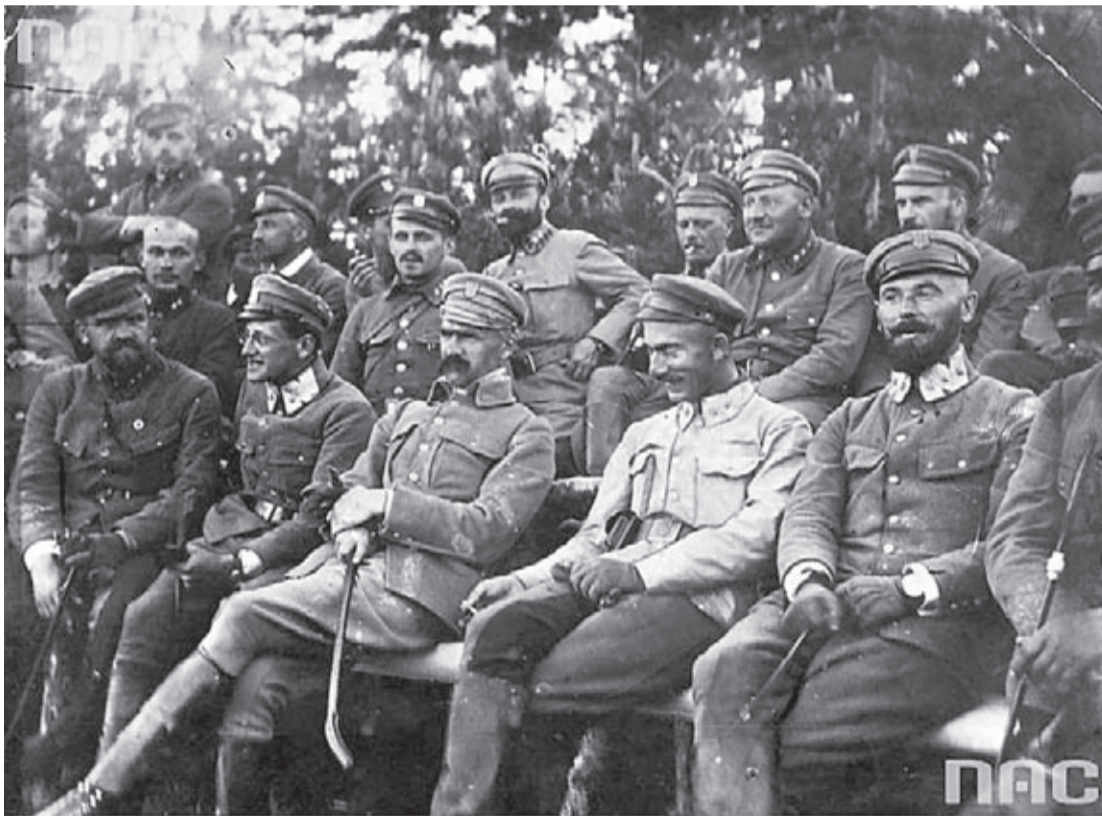
Narodowe Archiwum Cyfrowe, sygn. 1-H-198-2

Brak nienawiści pomiędzy zdecydowaną większością spośród żołnierzy walczących stron był doskonale widoczny podczas spotkań, do których dochodziło na ziemi niczyjej. Na całym odcinku frontu, obsadzonym przez oddziały legionowe, takich możliwości dostarczała jedynie Reduta Piłsudskiego. Niewielka odległość pomiędzy najbardziej wysuniętymi placówkami Reduty i ro-