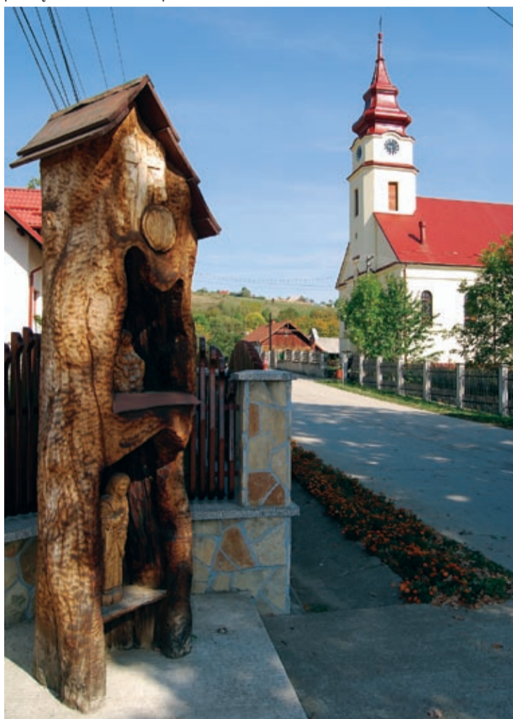
Kościół w Nowym Słońcu. Obok kapliczka rzeźbiarza Bolka Majeriki