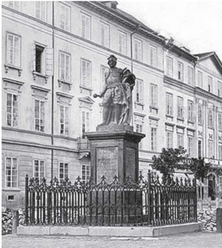
Pomnik hetmana Stanisława Jabłonowskiego na Wałach Hetmańskich

Dla Lwowa, gdzie miał swoją rezydencję, był wielkim dobrodziejem i fundatorem. Wiele dobrego zrobił dla mieszkańców miasta i za-