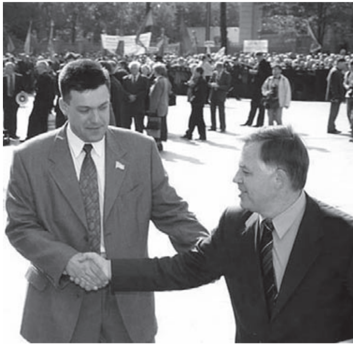
Przewodniczący partii „Swoboda” Ołeh Tiahnybok (od lewej) i przewodniczący KPU Petro Symonenko

Elektorat ze Wschodniej Ukrainy, rozczarowany w PR, poddał się z kolei komunistycznej retoryce. Niepotrzebnie ich lider, Petro Symonenko, ogłosił od razu, że będzie wszechstronnie wspierał w swych działaniach PR. Po tym niech ktoś powie o mądrości ukraińskiego narodu?