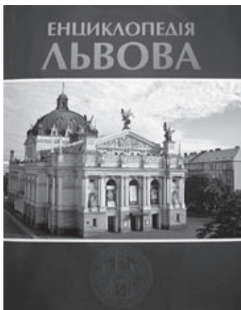
„Encyklopedia Lwowa”, tom czwarty

Z drugiej strony specjalistyczna literatura naukowa jest dostępna wyłącznie dla niewielkiej grupy uczonych. Dlatego istnieje problem z wydawaniem takich pozycji, które byłyby dostępne i interesujące dla szerokiego kręgu lwowiaków i turystów, również naukowców. Tylko poszczególne wydawnictwa lwowskie mogą sprostać tak skomplikowanym wymaganiom. Potrzebne jest też odpowiednie podejście do poszukiwania tematów i angażowanie wartościowych autorów. Wśród takich oficyn wydawniczych należy wyróżnić „Litopys” – wydawnictwo, które podjęło się ambitnego zadania wydania „Encyklopedii Lwowa”. Tylko nieliczne miasta europejskie posiadają takie wydania. Są to zazwyczaj jedno- lub dwutomowe opracowania, często skąpo ilustrowane. Nawet Kraków ma jednotomową encyklopedię. Wydawnictwu „Litopys” udało się zaangażować ponad 300 autorów, praktycznie ze wszystkich dziedzin nauki, kultury