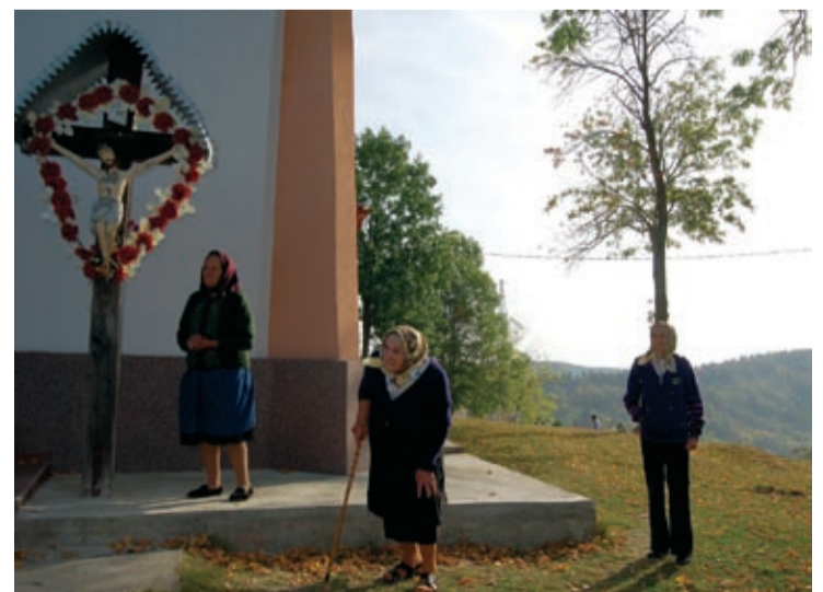
Plesza. Przed najwyższym położonym polskim kościołem na Bukowinie Południowej