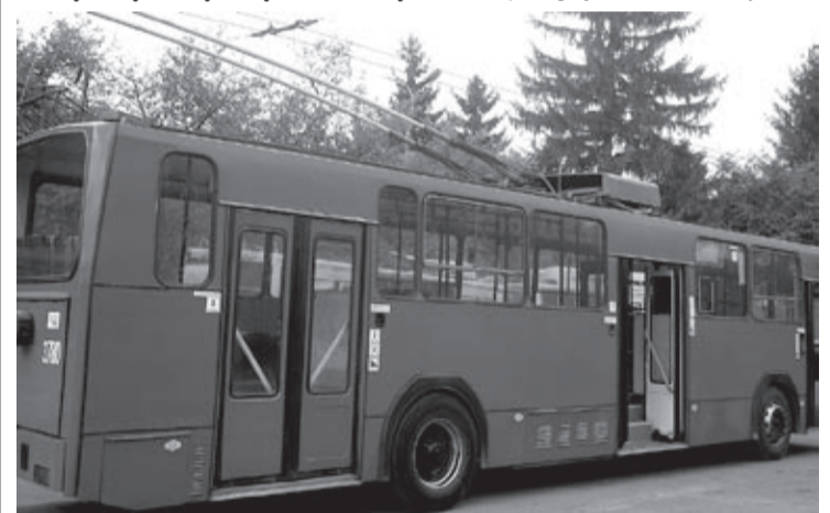
Ten trolejbus niedawno jeździł po Lublinie

Według słów dyrektora przedsiębiorstwa, na dziś w Łucku potrzeba około 70 trolejbusów, a z 58 pojazdów niewiele ponad 40 wyjeżdża na trasę, reszta jest ciągle „na remontach” i przeglądach technicznych.