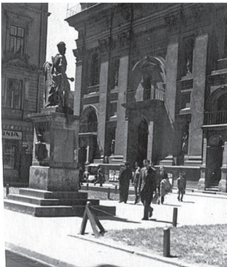
Pomnik hetmana Stanisława Jabłonowskiego na placu Trybunalskim, przed kościołem jezuitów

Po wybuchu II wojny światowej, tzn. „pierwsi bolszewicy” nie zrobili pomnikowi krzywdy. Nie zaszkodzili mu też Niemcy po 1941 roku. Dopiero w 1944 roku nowe władze miasta dały radę pomnikowi. W taki to sposób pierwszy świecki pomnik, cenny zabytek sztuki barokowej, zniknął bez śladu.