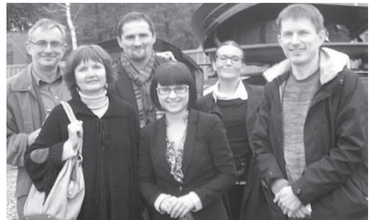
Dziennikarka Kuriera Galicyjskiego (pierwsza od lewej) z kolegami z Kuriera Lubelskiego

Przybyły tu rodziny polskie, obrabiały tę ziemię, gdzie nawet las nie chciał rosnąć. Gdy dzwoniły dzwony w kościołach – to nie pracowali i katolicy i prawosławni. I odwrotnie. Pobierali się i w cerkwiach. Dlatego, gdy teraz niektórzy starają się wyjaśnić, kto ma rację, a kto nie – nie słucham ich. Nie lubię ani jednych, ani drugich, którzy na tej bolesnej sprawie starają się zdobyć swą pozycję polityczną. Mam jedną odpowiedź – zostawcie to historykom, a ludziom, którzy zginęli oddajcie hold. Porządkowanie cmentarzy tu, na Wołyniu, zaczynamy od polskich pochówków. Jest to jak „Ojciec nasz”. Wtedy znikają pytania, ludzie uśmiechają się do siebie i współpracują”.