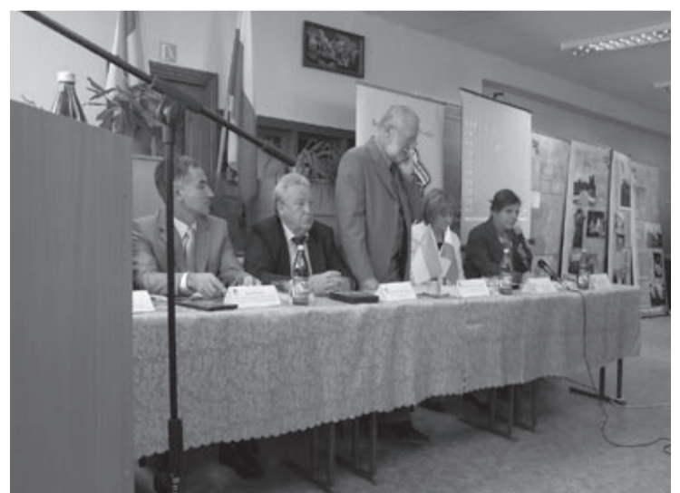
Podczas otwarcia konferencji