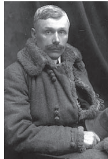
Płk Bolesław Roja

W czasie walki zdarzały się także przypadki cudownego ocalenia. Czasami jakiś wewnętrzny głos nakazywał udanie się żołnierzom w inne miejsce lub pozostanie w tym, w którym się znajdują. Szczęście nie zawsze przyjmowało formę przecucia nakazującego opuszczenie zagrożonego miejsca. Pod Kukłami jeden z