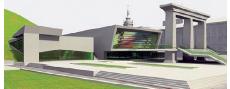
Projekt Centrum Polsko-Ukraińskiej Kultury