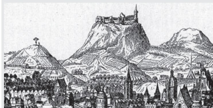
Rycina, Wysoki Zamek we Lwowie

Jest takie miasto na świecie Na siedmiu pagórkach stojące, Gdzie wiosną kwitną kasztany I bzy fioletem pachnące. Jest takie miasto na świecie, Gdzie zorze wiecznie palają, Gdzie w letnie ciche wieczory Srebrzyste gwiazdy spadają. Jest takie miasto na świecie, Gdzie rankiem łśni rosa na trawie, Gdzie w Stryjskim Parku pływają Białe łabędzie na stawie. Jest takie miasto na świecie, Gdzie szumią wuleckie drzewa, Gdzie Orłąt krzyże cmentarne, Wśród których cichy wiatr śpiewa. Jest takie miasto na świecie, Gdzie pamięć wieków wciąż żyje, Gdzie każdy zakątek – historią, serce gorące bije. Jest takie miasto na świecie,