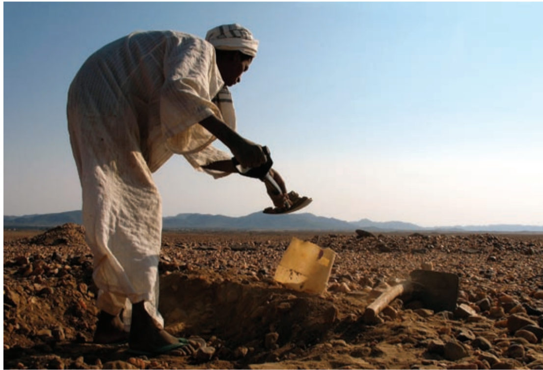
Pochówek meroicki – początek eksploracji

Bardzo dziękuję za rozmowę! Wierzę, że uda Ci się zrealizować wszystkie te plany i marzenia, a za rok znów się spotkamy na równie ciekawą rozmowę.