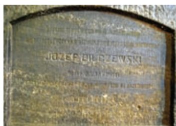
Tablica ku czci arcybiskupa Józefa Bilczewskiego w podziemnym kościele

czem, chodził między Sokołcem, Pleszem a Pojaną Mikuli i wszędzie odprawiał msze w języku polskim. I najczęściej miał ze sobą torbę z jedzeniem, aby go wilki nie zjadły. Później z Polski zafundowano mu samochód terenowy. Dziękujemy Bogu, że był taki człowiek i mógł polskość tutaj podtrzymać. A grekokatolicy przechodzili na wiarę prawosławną. Do II Soboru Waty-