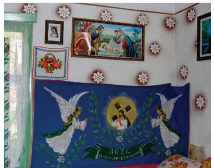
„Boże, błogosław tej rodzinie” – napis na przedwojennym kilimie w pokoju drewnianego budynku w polskiej wsi Plesza

moją matką. I teraz, jak idę do kościoła, to lubię siedzieć z tyłu, aby mnie nikt nie widział. To jest taki stres dla mnie. Jak jest dużo ludzi w kościele, to nie czuję się dobrze. Nie mogę się modlić. Jak obchodzono święta? – I grekokatolickie, i rzymskokatolickie Boże Narodzenie było jedno. Ale dwa razy obchodzono Wielkanoc, Wniebowzięcie, Zielone Święta. Czemu by tak nie robić? Czemu by nie świętować więcej?