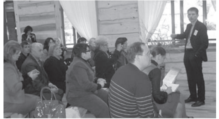
Na posiedzeniu jednej z sekcji konferencji

W malowniczej scenerii jeziora Świtez na Wołyniu, w ramach III części „Szkoły współczesnego dziennikarstwa” odbyła się międzynarodowa konferencja „Od współpracy regionalnej do partnerstwa międzynarodowego”. Program realizuje „Forum dziennikarzy ukraińskich” przy współudziale administracji wojewódzkiej.